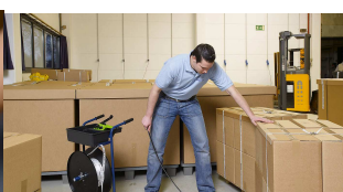
Rollwagen und Palettiernadel erweisen sich als unverzichtbares und praktisches Zubehör.