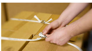
Voraussetzung für den geringen Schlupf und die hohe Systemfestigkeit sind die speziellen Drahtbiegeschnallen.